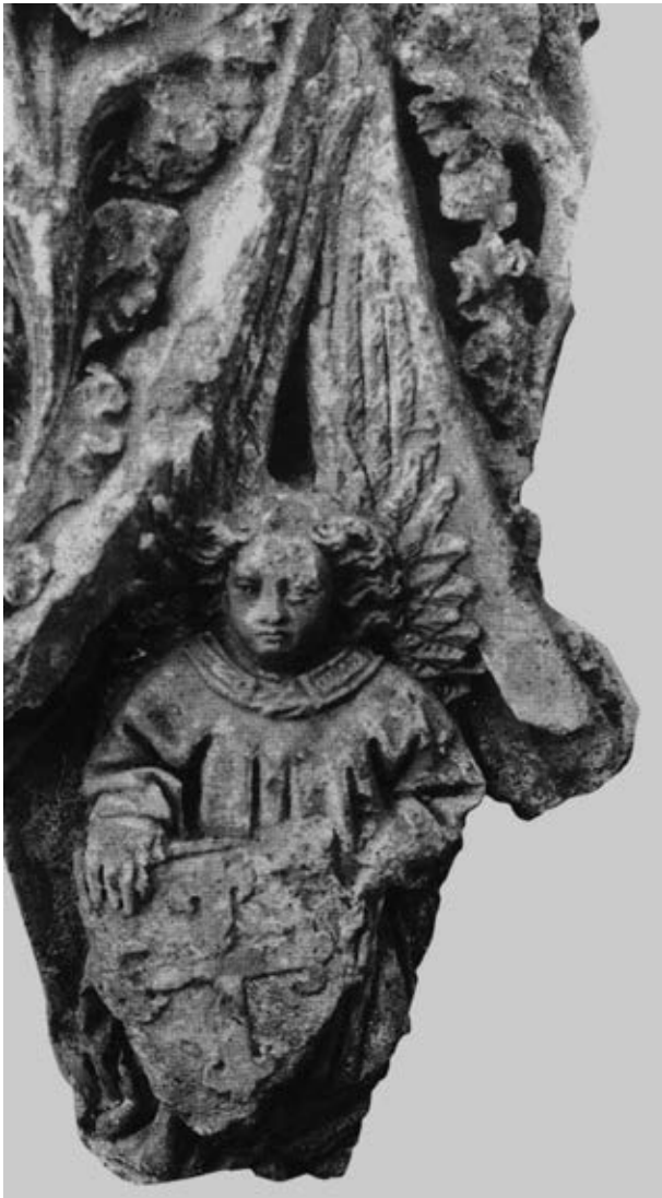
Remat d'arc conopial amb àngel sostenint l'escut de l'Orde de Montesa. Sarthou, c. 1950

Al claustre, àmbit on continuaren les excavacions, s'assenyala la troballa d'algunes claus de volta, dovelles, ceràmica i alguns elements d'algeps que desconeixem hui, però que caldria relacionar tal volta amb l'important episodi de treballs en guix realitzats al castell durant el primer terç del segle XVI 6 .