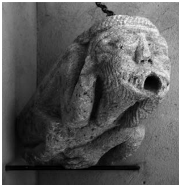
Gàrgola (Museu Parroquial de Montesa)

Què es va fer dels elements que viatjaren a l'exposició de València?. Alguns, tal volta tornaren a Montesa, com