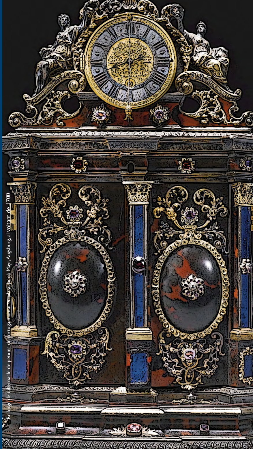
Reloige de tabernacle de peçxina de l'orgue muntesa en plata, Jacob Mayr, Augsburg, al voltant de 1700

Informació de l'orgue, amb documentació i programes de concerts, a la web http://www.museumontesa.com/