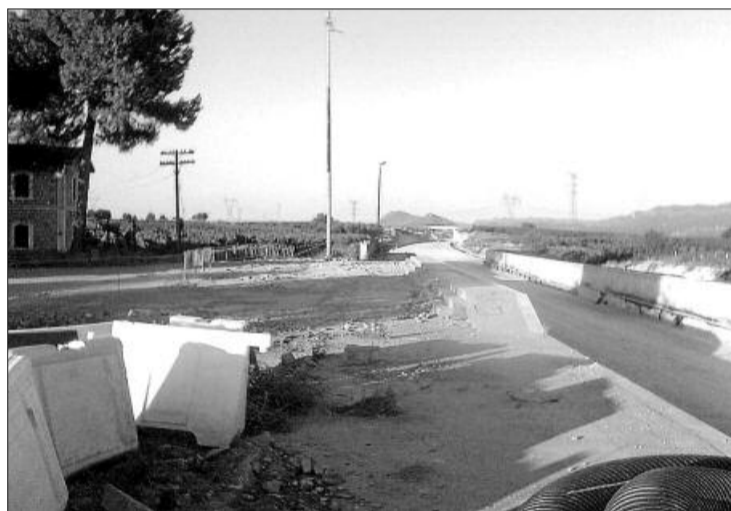
Espacio que ha dejado el derribo de la parada de tren de Montesa.

más de 30 años, el modesto pero entrañable edificio permaneció sin utilidad hasta que Adif pidió permiso de derribo al consistorio porque el techo estaba desfondado. Algunas voces reclamaron su protección (era de 1904) y que el