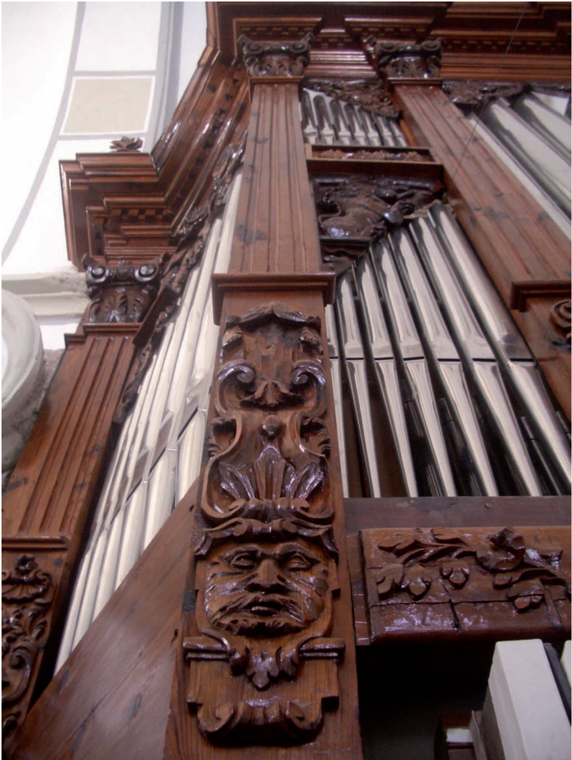
Fig. 2.- Orgue de Montesa. Detall.