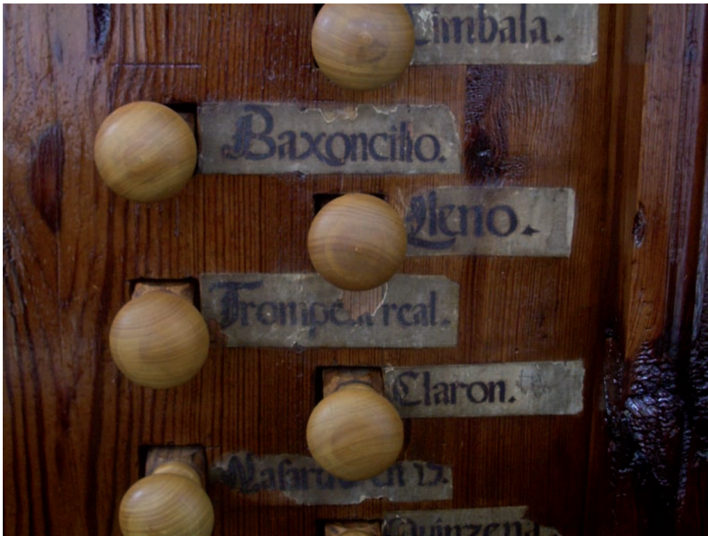
Fig. 3.- Detall dels rètols dels registres de mà esquerra.