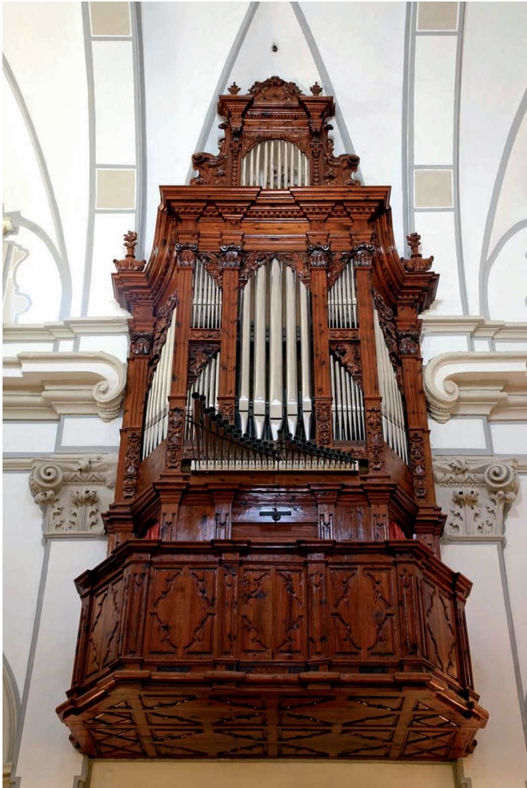
Fig. 1.- Orgue de Montesa. Martín de Usarralde, 1744.