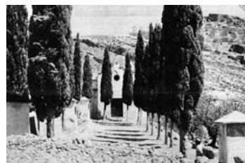
Fig. 5.- Montesa: Ermita del calvari, vista general, 30 d'agost de 1970

donaven testimoni oral alguns major de Montesa. 29 La frontera de remat esglaonat sense campanaret que hi ha hagut fins a la darrera intervenció (figs. 5), degué construir-se en aquell moment,