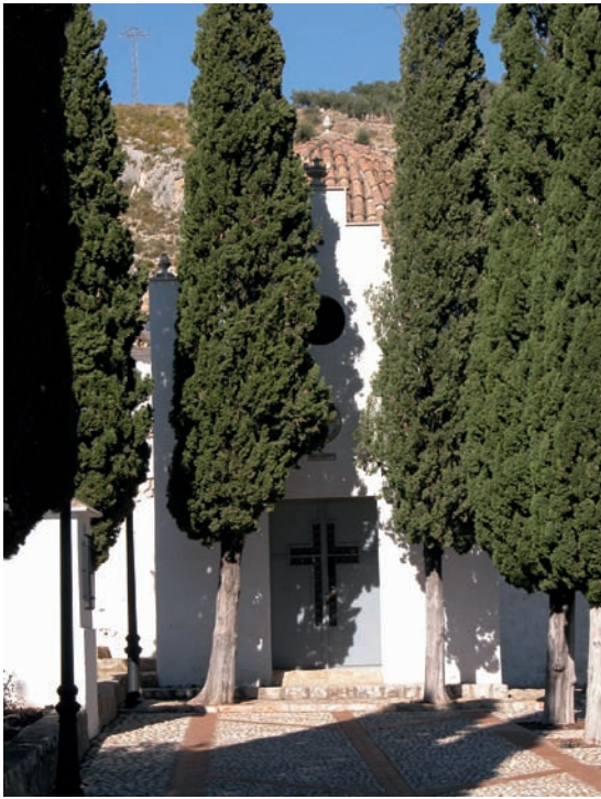
Fig. 6.- Montesa: ermita del Calvari, frontera, 13 de novembre de 2004.