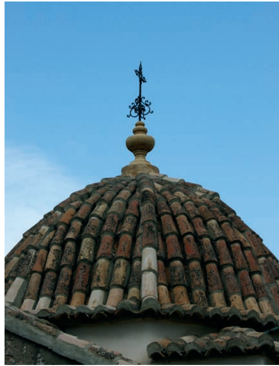
Fig. 7.- Montesa, ermita del Calvari. Cúpula, 9 de juliol de 2009.

estar novament lluída i els escalons que la remataven i la cúpula es van decorar amb unes pinyes i jarros decoratius de ciment emmotllat (fig. 6). 32