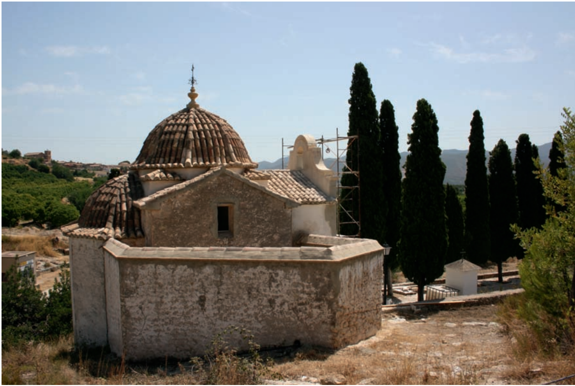
Fig. 1.- Montesa: Ermita del Calvari, vista general, 5 de juliol de 2009.

Tampoc no és massa encertada la descripció que de l'ermita del Calvari de Montesa es va fer el 1999 al volum que inicia la col·lecció Monumentos desaparecidos de la Comunidad Valenciana , on pràcticament se la presenta com a un edifici pràcticament en ruïnes: