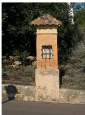
Fig. 4.- Montesa: Calvari, única caseta antiga que es conserva amb la fesomia original.

La següent intervenció de la qual hi ha constància és del 1982. Va consistir a reenteular l'ermita, col·locar-hi un paviment ceràmic actual –encara es conserva, tot i que està previst