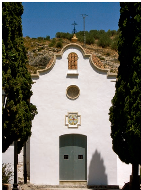
Fig. 9.- Montesa, ermita del Calvari. Frontera, estat actual.

construcció, s'ha lluit de nou amb morter de calç i sorra i s'ha emblanquinat amb calç. L'òcul central s'ha tancat amb pedra d'ònix, per tal de tamissar la llum a l'interior (fig. 9). 44