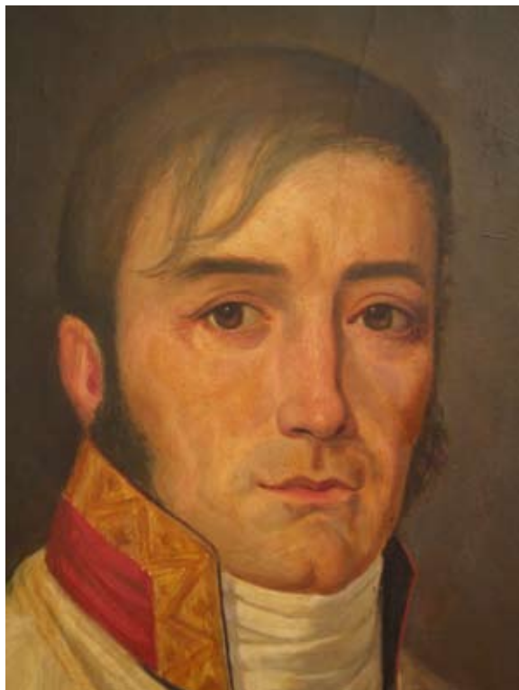
Fig. 5.- Detall del rostre