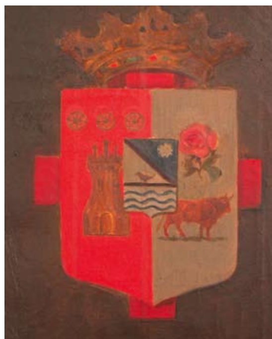
Fig. 4.- Detall de l'escut pintat al quadre